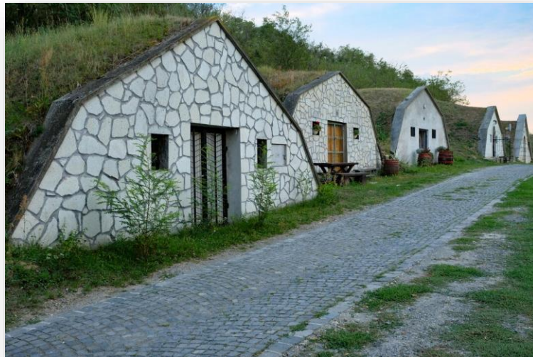
Obrázok 6 Tokajské pivnice

Jeden zo skrytých pokladov Zemplínskych vrchov. Systém vínných pivníc švábskej dediny v oblasti Tokaj-Hegyalja je súčasťou svetového dedičstva. Tvorí ho 195 pivníc, nachádza sa len pár kilometrov od Sárospataku a oživuje starý vidiecky život a tradičné kultúry pivničníctva.