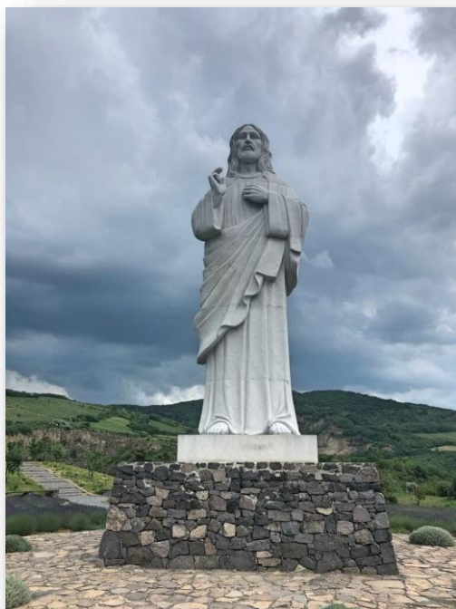
Obrázok 2 Áldó Krisztus szobor

Socha Krista nad dedinou Tarcál bola v roku 2015 postavená najväčšia socha Ježiša v Maďarsku s nádherným panoramatickým výhľadom. Bola k nemu navrhnutá aj oddychová zóna so schodiskami a chodníkmi. V polovici cesty vedie ďalšia cesta k jazeru bane.