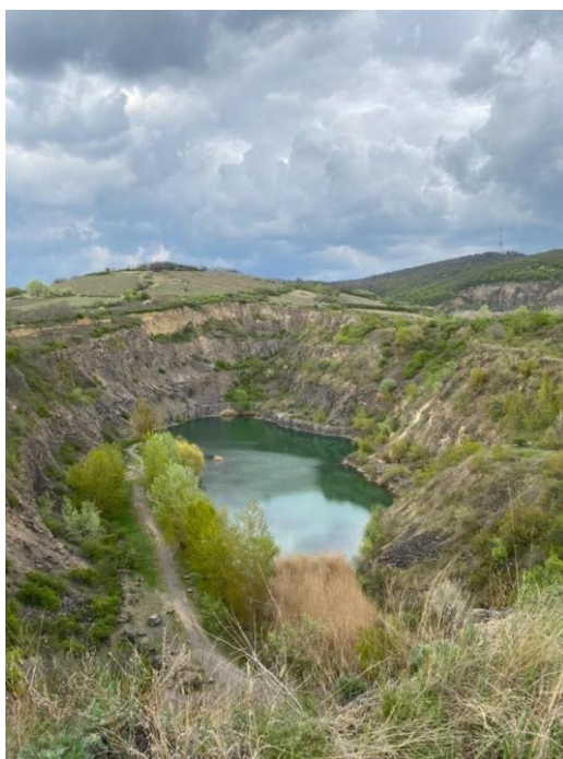
Obrázok 3 jazero