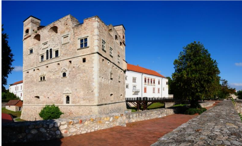
Obrázok 5 Blatnopotocký hrad

Je známy ako majetok rodiny Rákóczi a je najobľúbenejšou pamiatkou v meste Sárospatak. Jedno z najkrajších diel neskorkej renesančnej architektúry v Maďarsku a domov pamätných vecí slávnej rodiny.