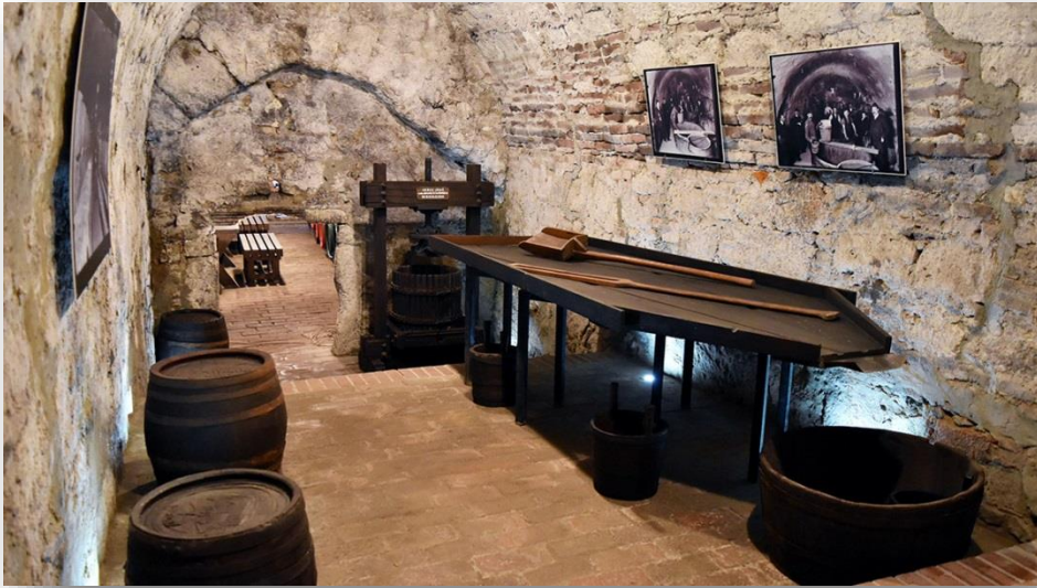
Obrázok 4 múzeum

Tokajské múzeum je možné navštíviť v srdci Tokaja od mája 1985. Niektoré interiéry budovy zobia nástenné maľby nebývanej hodnoty, napríklad panoramatická maľba jednej z prízemných miestností vyvoláva dojem, že sa pozorovateľ prechádzal po brehoch Tisy pred dvesto rokmi. Celý materiál prezentujúci vinohradníctvo Tokaj-Hegyalja bol prenesený do Múzea vín svetového dedičstva, ktoré bolo odovzdané koncom roka 2015, čím sa rozšírila interaktívna expozícia 21. Storočia.