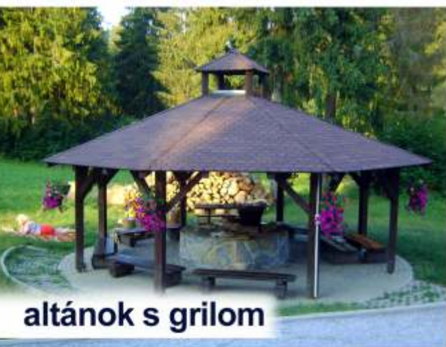
altánok s grilom